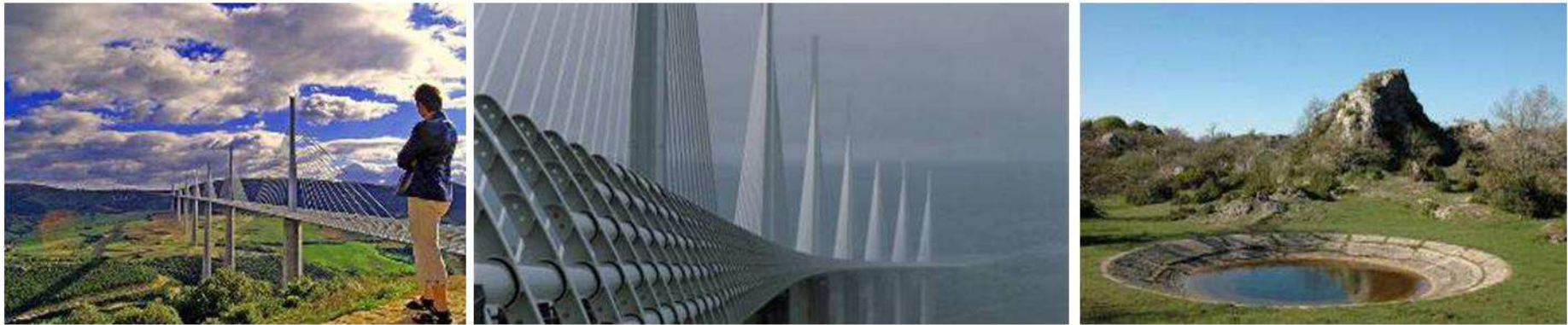
Viaduc de Millau, les Gorges du Tarn, le Plateau du Larzac, les Caves de Roquefort