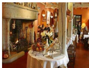
Hostellerie du Relais de Farrou : restaurant sélectionné pour le repas de l'Assemblée Générale.