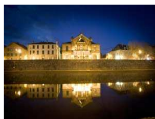
Théâtre Municipal, lieu de l'Assemblée Générale Extraordinaire, Statutaire et Elective : aspect extérieur et vue intérieure.

A l'issue de l'Assemblée Générale Extraordinaire, Statutaire et Elective, un déjeuner est prévu au Restaurant de l'Hostellerie du Relais de Farrou.